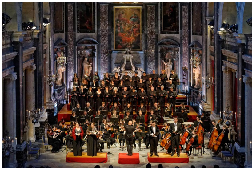
Place au silence