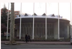
4/ Le centre international de recherche sur le cancer (CIRC)

Donnez-nous votre avis sur la page instagram du Petit Bulletin !