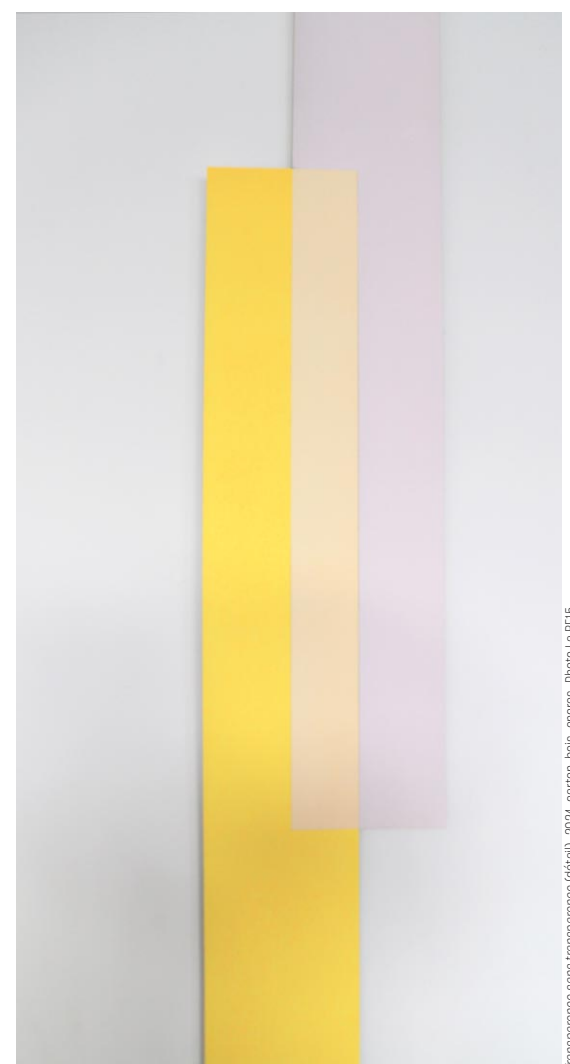
Kill Bill version minimaliste

À la BF15 (Lyon 1 er ), jusqu'au 23 mars