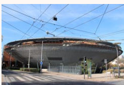
3/ L'amphithéâtre 3000