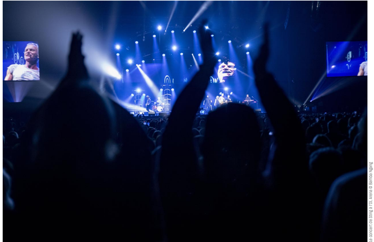
Pourquoi y a-t-il toujours quelqu'un de plus grand devant ?