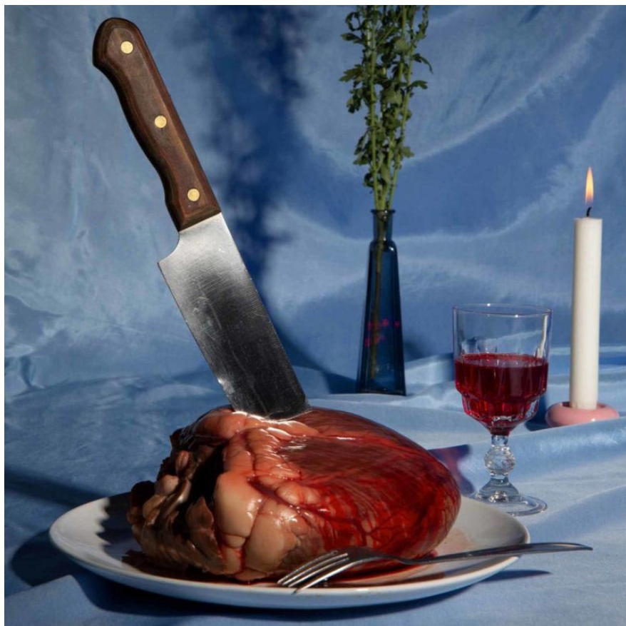
Avec un bon chianti ce sera délicieux

Ce que je t'ai offert, 2020 © Marguerite Rouan