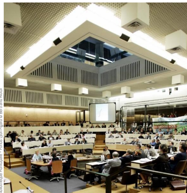
Bibliothèque municipale - Fonds Lyon Figaro © Bertrand Ricior

Le duo d'urbanistes-architectes à l'origine du bâtiment, Gimbert et Vergély, a une rela-