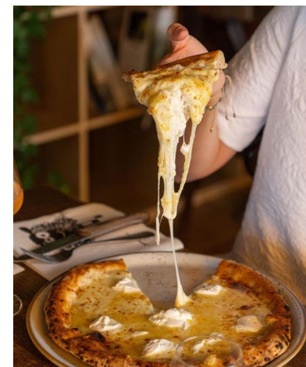
Tengo la Pecora Negra

Si on craint d'être déçu, il y a aussi des pâtes (de blés anciens). De notre côté, on a été bluffés par la panacotta, de la vraie sans gélatine ni agar-agar, avec une texture de glace à la vanille et un