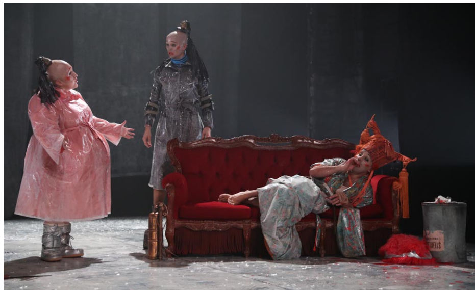
Mais 37.2° le matin