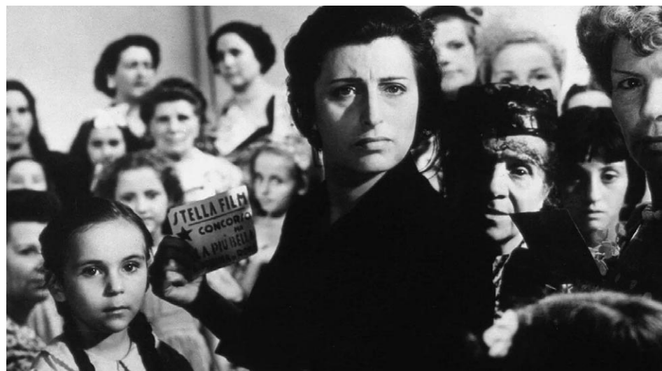
Projeter son désir d'actrice sur sa propre fille : Anna Magnani dans Bellissima

Anna Magnani, judicieusement célébrée deux mois durant à l'Institut Lumière, explose après des débuts timides lorsque Roberto Rossellini lui confie le rôle de Pina dans Rome, ville ouverte, film-phare du néo-réalisme. Dans l'équation, le réalisme tient à la mise en scène d'une