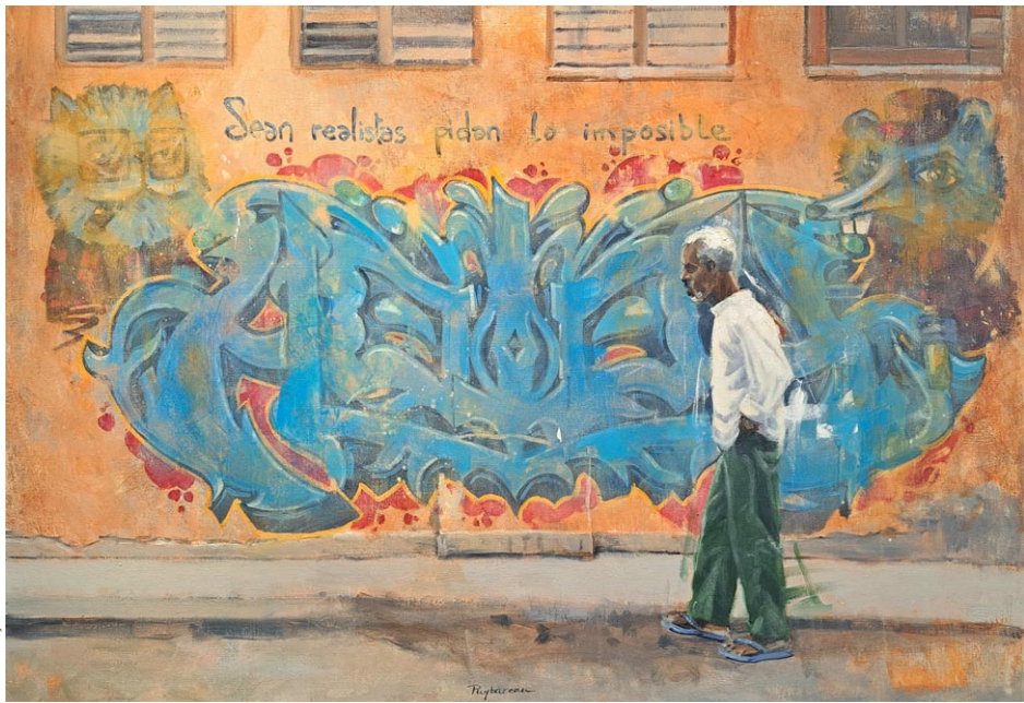
Peinture Sèche #6