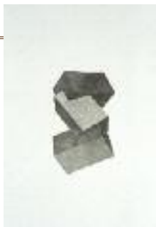
Sans titre, Aquatinte