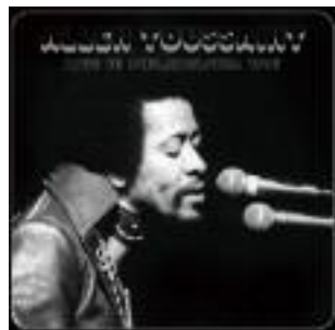
Allen Toussaint - Live in Philadelphia 1975 (Rhino)

Parce qu'il n'y a pas plus bel hommage à rendre au King of New Or-