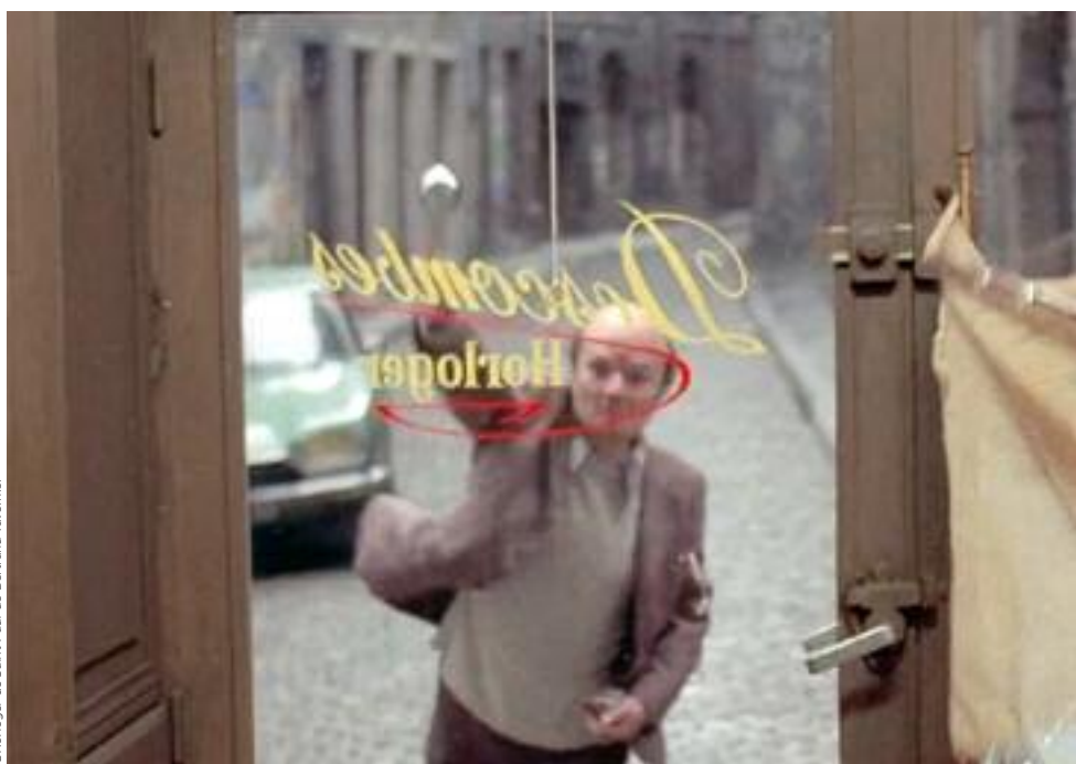
L'Horloger de Saint-Paul de Bertrand Tavernier