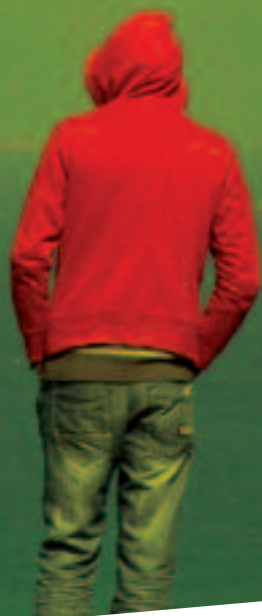
Photo © Patrick Zachmann - Magnum Photos // Conception graphique Yannick Bailly - item •