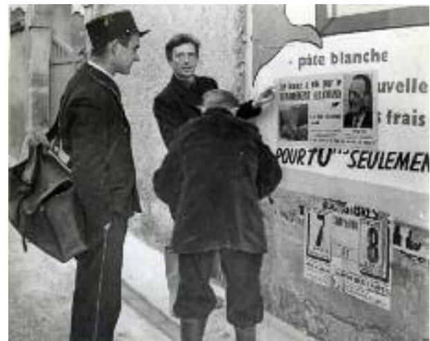
L'Ain, territoire d'adoption découvert pendant la guerre

L' auteur du Regard Froid , essai essentiel paru en 1963, a longtemps vécu dans l'Ain. Originaire de Reims, il a découvert la région pendant la guerre, en 1942, alors qu'il s'était engagé dans la Résistance (lire à ce sujet le tout aussi essentiel Un jeune homme seul ) et s'était réfugié à Chavannes-sur-Reyssouze, après un passage par Lyon suite à la défaite en 1940. Roger Vailland reviendra s'installer dans le Bugey en 1951 avec sa compagne et donnera cette région pour cadre à plusieurs de ses romans, dont 325 000 francs, qui explore les affres d'une usine de plastique d'Oyonnax. L'écrivain s'installe ensuite à Meillonas, où celui qui fut aussi grand reporter et scénariste pour Roger Vadim et René Clément, fut enterré à sa mort en 1965, à une centaine de mètres de la maison qu'il occupa dès 1954 dans ce petit village du Revermont.