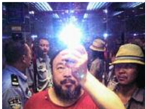
Ai Weiwei, Selfie.

Dans le catalogue de l'exposition, l'historien de l'art Wolfgang Ullrich défend un point de vue original sur le phénomène selfie apparu