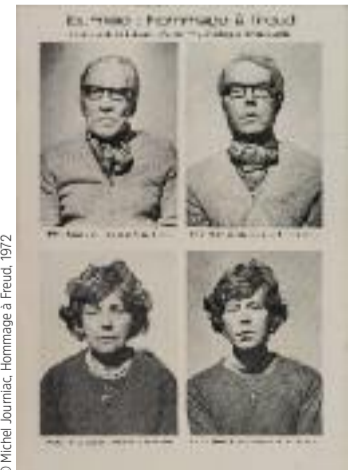
© Michel Journiac, Hommage à Freud, 1972

À la galerie Michel Descours jusqu'au 25 juin