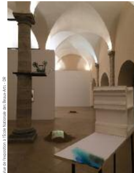
Vue de l'exposition à l'École Nationale des Beaux-Arts

Le groupe de recherche Art Contemporain et Temps de l'Histoire (ACTH à l'École Nationale des Beaux-Arts de Lyon), réunissant artistes et historiens de l'art, propose une alternative aux conceptions habituelles de l'histoire de l'art et de l'image, basées sur la linéarité et la succession d'époques (l'impressionnisme, le cubisme, le surréalisme...). Avec ACTH, les œuvres dialoguent entre elles de manière anachronique, et s'ouvrent aussi à l'histoire politique, et, plus singulier encore, à l'histoire naturelle et à la géographie. La série de Vagues peinte par Courbet en 1869 résonne, par exemple, avec un film expérimental de l'artiste contemporain Michael Snow, et se voit reliée aux concepts "biologiques" de rythme et de cycle, ou avec des faits historiques tels que la Commune de Paris et la destruction de la colonne Vendôme.