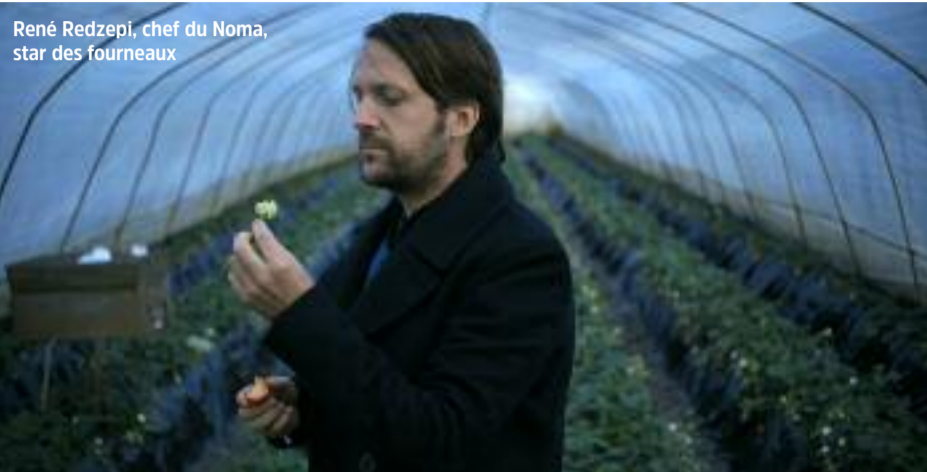
René Redzepi, chef du Noma, star des fourneaux