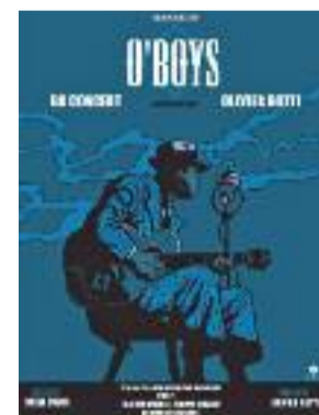
O'Boys © Steve Cuzor

aussi celle de personnages fictifs, peuplant l'imaginaire des artistes. Alors, quand un dessinateur et un chanteur de blues décident d'allier leurs forces pour conter une histoire, le résultat peut s'avérer saisissant. Avec O'Boys , Steve Cuzor raconte le voyage initiatique de deux amis, l'un blanc, l'autre noir, dans l'Amérique des années 1930, celle qui souffrait de la Grande Dépression, du racisme et de la misère. Sur scène, les bulles de cette BD sont dépouillées de leur texte, laissant au chanteur Olivier Gotti la tâche de rendre la parole aux personnages. Et quoi de mieux que le blues pour donner corps à cette aventure, qui se déroule précisément où celui-ci est né ? L'œuvre est belle et