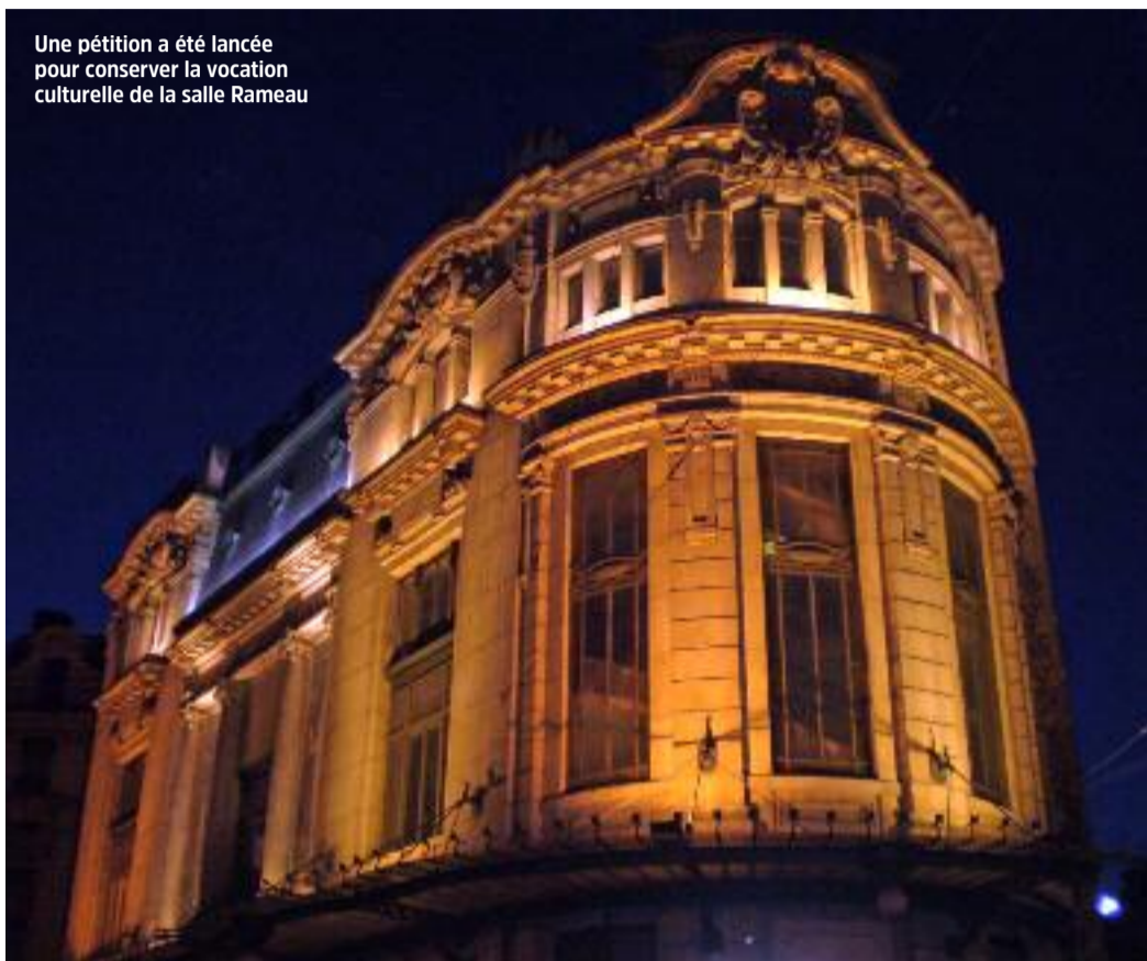
Une pétition a été lancée pour conserver la vocation culturelle de la salle Rameau

Située au 31 rue de la Martinière, dans le 1 er arrondissement, cette salle de style Art Nouveau est un marqueur du quartier comme de la vie culturelle lyonnaise. Que ce soit pour ce qu'elle représente en terme architectural, ou dans l'histoire de la cité par le nombre de spectacles qu'elle a pu accueillir en son sein (du classique bien sûr, du jazz mais aussi de l'humour ou des conférences y ont été programmés), la salle Rameau intéresse et passionne. Et son futur peut inquiéter : un collectif de citoyens et d'associations s'est donc constitué pour lancer une pétition sur le site Change.org, ayant recueilli 748 signatures à ce jour. La crainte de voir fleurir une supérette ou des appartements à sa place inquiète. La maire de l'arrondisse-