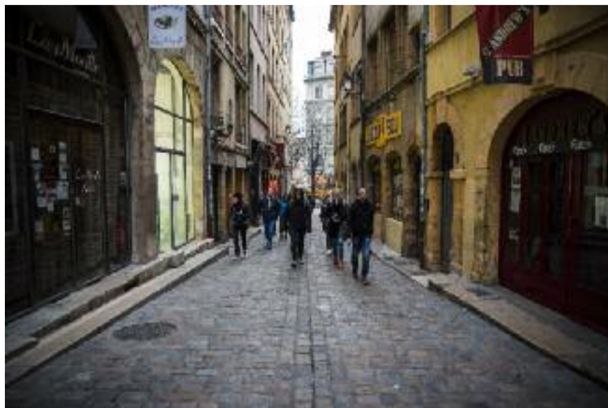
Le pub, c'est la première à gauche

Là, à la sortie du métro, juste sous vos pieds, campe un plan du Vieux-Lyon que vous n'aviez probablement jamais remarqué. Et saviez-vous que l'impasse Turquet, perpendiculaire à la Montée du Gourguillon, est constituée de deux maisons médiévales qui sont les seules à avoir conservé leurs galeries à pans de bois ? Qu'une pierre précieuse de la tiare du pape Clément V est enlevée montée du Gourguillon ? Que la statue que vous aviez toujours prise pour un bœuf à l'angle de la rue du Bœuf et de la place Neuve-Saint-Jean est en réalité un taureau ?