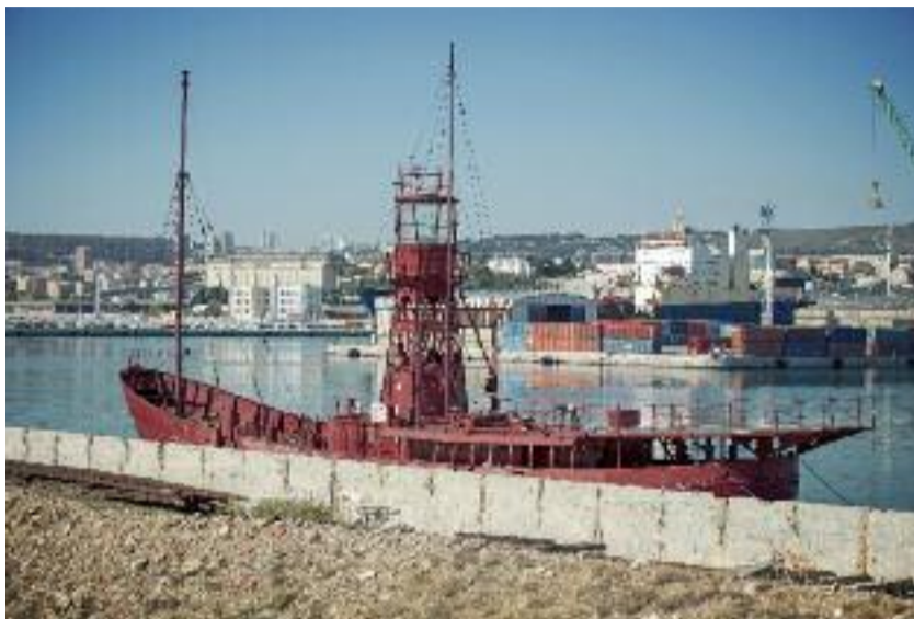
Le Razzle, est actuellement à Marseille. Et ne viendra peut-être jamais à Lyon