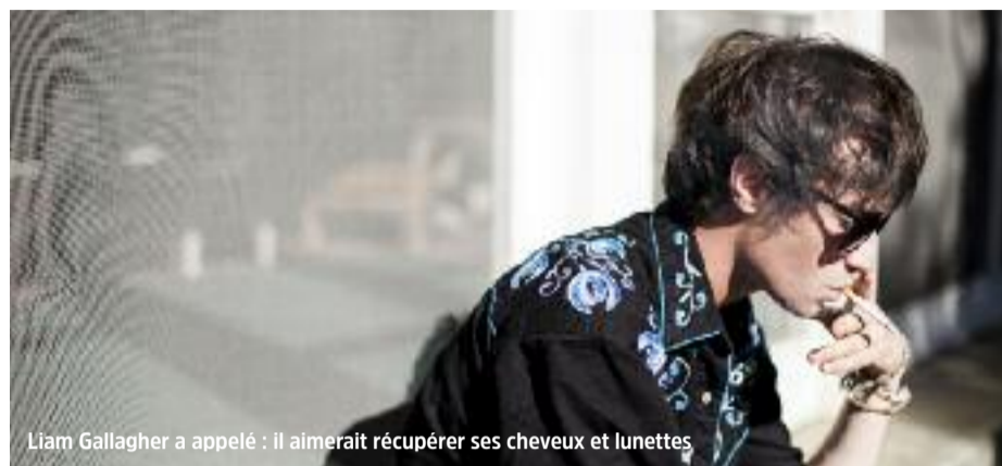
Liam Gallagher a appelé : il aimerait récupérer ses cheveux et lunettes