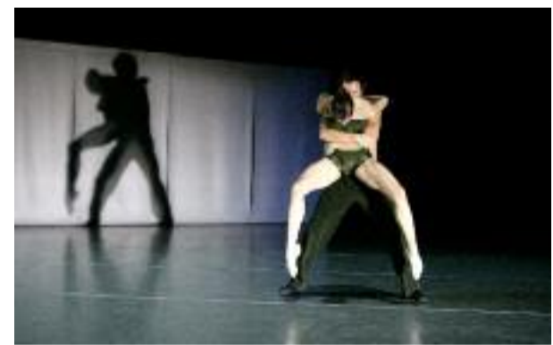
Voilà ce qui arrive lorsqu'on oublie ses escarpins

Après Stravinski, Mozart, Debussy ou le romantisme de La Nuit transfigurée de Schönberg, Kylián s'est penché, en 2004, sur le monde plastique de l'artiste italien Lucio Fontana (1899-1968), connu pour ses toiles monochromes percées ou fendues (les fameux Concetto Spaziale ). Les deux artistes partagent un même souci de la spatialité que Kylián, dans un entretien en 2010, rappelle ainsi : « Lucio Fontana a pris un couteau et a détruit la surface monochrome de la peinture. Mais son acte destructeur a donné une nouvelle vie à sa peinture... une 3 e dimension. Il a ouvert une porte secrète, celle de l'inconnu... Seulement un début... Il nous faudra chercher