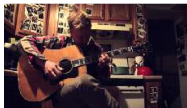
Ah, et The Edge demande à ce qu'on lui rende sa vieille chemise