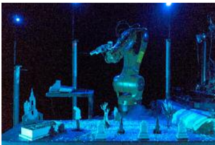
Robot pour être vrai

J'ai l'impression que pour aller au bout du projet, il faut que la représentation à laquelle on assiste soit une représentation des machines à l'intérieur de laquelle les seuls humains en présence soient les spectateurs ou les visiteurs. Il y aura plus de projec-