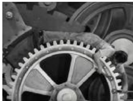
Précédemment, dans Engrenages...