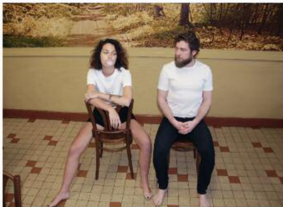
L. COMME LYONNAISE - COLLECTION 2017

RETROUVEZ L'INTÉGRALITÉ DES PROGRAMMES ET DES ARTICLES SUR PETIT-BULLETTIN.FR