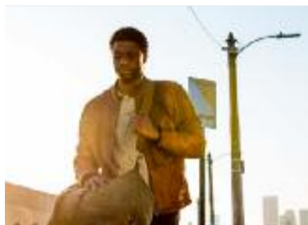
Il a été privé d' Hallucinations Collectives ...

D ix bougies soufflées et 1000 univers à dévorer ! Point de ralliement pour tous les cinéphiles déviants, Hallucinations collectives rouvre les portes de sa "Chambre des Merveilles" regorgeant de nouveautés aussi folles que drôles, tantôt connues, tantôt oubliées. Digne d'une chasse aux œufs punk, la soirée d'anniversaire régaler ses invités d'une ribambelle de court-métrages, clips et bandes-annonces inédits, en passant par la projection d'un film secret en avant-première mondiale. En plus d'accueillir Fabrice Du Welz, pont à lui seul de la Belgique aux États-Unis avec son Message from the King en avant-première, attardons-nous un instant sur deux films qui résument le sens de cette manifestation, antinomiques sur la forme mais oniriques dans le cœur : Soy Cuba de Mikhaïl Kalatozov et Litan de Jean-Pierre Mocky. Redécouvert dans les années 1990, le premier se pose en classique oublié, fascinant pour ses multiples morceaux de bravours mythiques, tels que ses plans-séquences impossibles. Dans le second, un OVNI cinématographique venant d'un auteur ayant davantage habitué le public à des comédies grinçantes, Mocky s'attelle au fantastique le plus carnavalesque.