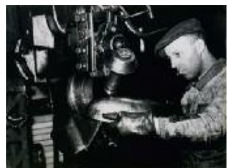
Hier, dans Plus belle la vis...