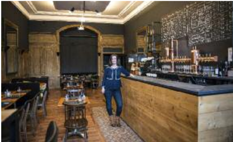
La bière est dans l'Eire du temps - soit dit sans vous mettre la pression...