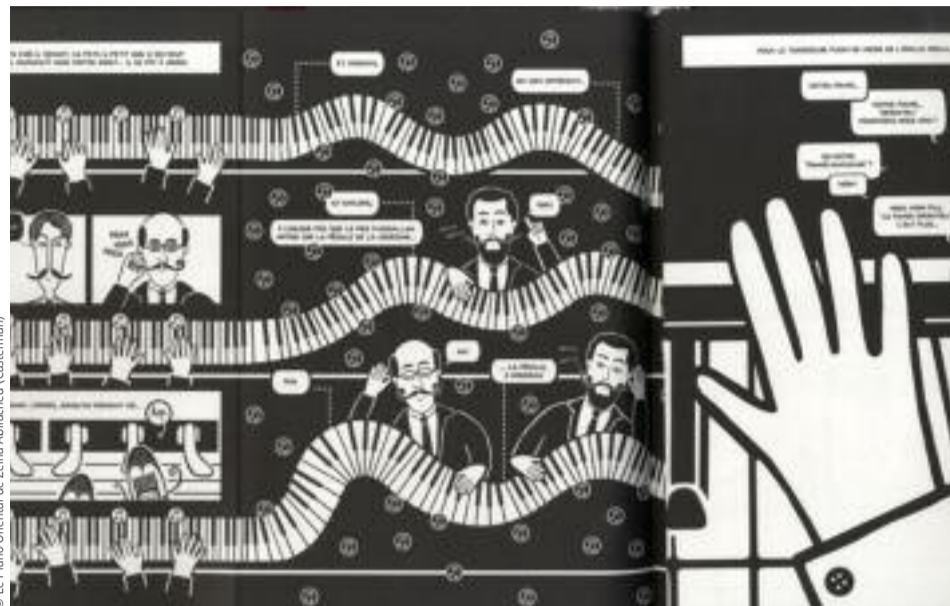
© Le Piano Oriental de Zeina Abirached (Casterman)

L'Art invisible, c'est le titre de l'exposition et aussi de l'essai de Scott McCloud ( Understanding Comics en version originale). À quoi cette expression fait-elle référence ? Elle évoque le langage, le mode de narration spécifique à la bande dessinée : un jeu et un équilibre entre ce qu'on voit et ce qu'on ne voit pas. On n'impose pas un rythme avec un montage comme au cinéma par exemple. Chaque case est séparée d'une autre par une ellipse, on oblige le spectateur à construire, imaginer ce qui se passe. On est beaucoup plus dans la suggestion.