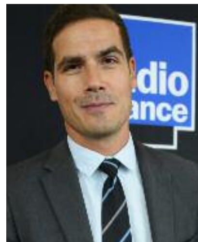
L'arrivée de France Bleu à Lyon toujours d'actualité sous la houlette de Mathieu Gallet

En effet, le ministère de la Culture et de la Communication avait la possibilité de préempter cette fréquence au bénéfice du service public, jusqu'à l'attribution par le Conseil Supérieur de l'Audio-visuel à l'heureux élu. Il n'en a rien été. Dans son édition parue le 12 avril dernier, nos confrères de Intermédia révèlent que le directeur