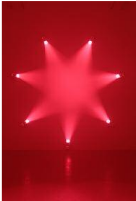
Oh, un heptagramme !