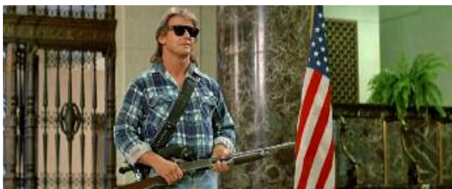
“ Je veux tes vêtements, tes bottes, et ta moto. Voyez avec Sarah Connor, porte à côté ”

E ncadré par sa fameuse Nuit des séries de science-fiction (à la polarité très politique cette année), et le vide-grenier du geek – soit deux gâteries pour mordus d’expériences ultimes combinant pizzas, liquides pétillants divers et fourbis électroniques, si l’on schématise honteusement –, le festival des Intergalactiques déploie en son milieu moult autres trésors. À commencer par ses séances cinéma. Une rétrospective de l’anticipation dystopique, des années 1960 à 1990, comprenant des films rares sur grand écran tels que le matriciel et épuré THX 1138 de George Lucas, le déprimant La Planète des Singes de Franklin J. Schaffner et le vrombissant La Course à la mort de l’an 2000 signé Paul Bartel. Prouvant au passage que le futur, ce n’était pas mieux avant. On ne saurait trop vous conseiller de garder des forces pour deux autres séances prodigieuses. D’abord, la soirée Invasions ! , avec le