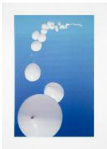
Sky Line, 1967 © Hans Haacke

Fluide, atmosphérique, sensible, décloisonnée, musicale... Telles seront les tonalités majeures de la 14 e Biennale de Lyon consacrée aux "mondes flottants", et deuxième volet d'une trilogie autour du thème de la "moderne". Cette modernité, Emma Lavigne, commissaire invitée, la conçoit comme liquide (en se référant au sociologue Zygmunt Bauman) avec « ses flux, sa vitesse qui à la fois connectent les gens et les