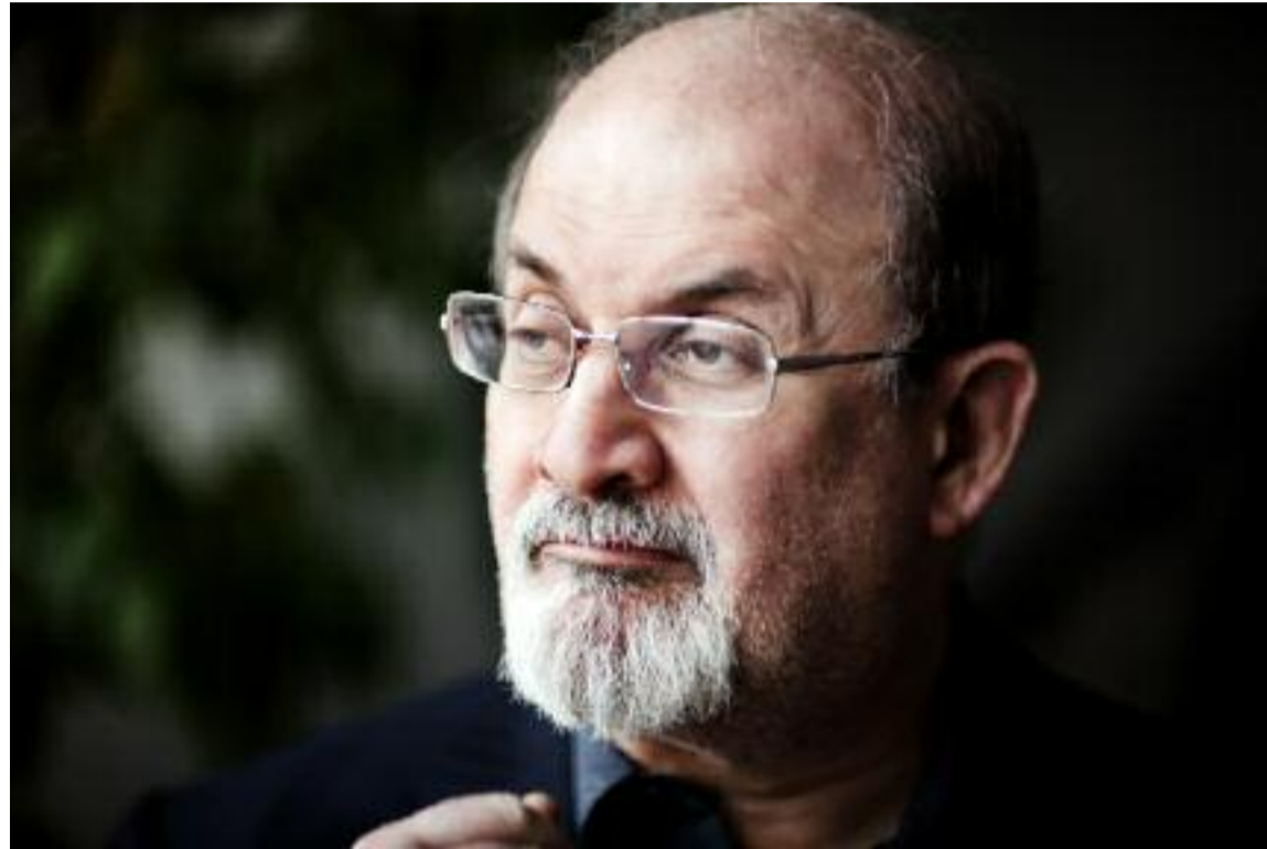
Vous pourrez venir écouter Salman Rushdie en baskets et en djinn

Le combat entre raison et fondamentalisme a toujours été au cœur de votre travail. Or votre père a changé son nom, votre nom de famille, pour celui de Rushdie en raison de son admiration pour Ibn-Rushd, dont les livres ont été brûlés comme les vôtres après la publication des Versets Sataniques . Votre travail est-il un atavisme ? À vrai dire, j'ai surtout été ébahi de constater à quel point le choix de