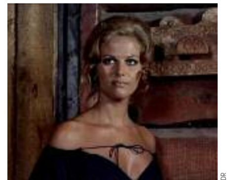
Ne perdez pas le fil

La proximité de la proclamation du palmarès cannois est l'occasion toute trouvée d'évoquer le cycle Claudia Cardinale, qui marque sa mi-temps à l'Institut Lumière. Cette semaine en effet, le public a la chance de redécouvrir sur le très grand écran de la rue du Premier-Film deux jalons du cinéma italien des années soixante. Deux œuvres qui connurent en leur temps des succès immenses et cependant distincts : l'une fut Palme d'Or en 1963, l'autre s'imposa au box-office de 1969 en attirant près de 15 millions de spectateurs dans les salles françaises. Un demi-siècle plus tard, leur prestige n'a pas diminué – au contraire. Désormais revêtues d'une élégante et respectable patine, elles se voient érigées au rang de classiques indiscutables. Et leur confrontation révèle d'étranges similitudes. Car au-delà de leurs différences stylistiques ou d'époque, l'épopée Le Guépard de Luchino Visconti et le western Il était une fois dans l'Ouest de Sergio Leone se ressemblent par leur ambition opératique. Ils partagent surtout une même thématique : la description d'un changement d'époque, d'un basculement (d'une disruption, comme l'on dit volontiers de nos jours). Pour le prince Salina, c'est le Risorgimento et les incertitudes pesant sur la