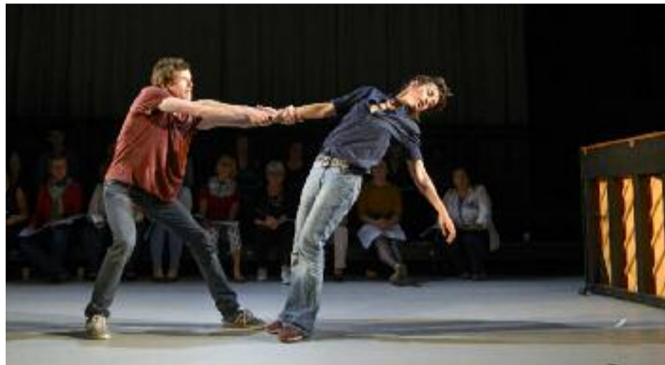
Les enfants, le GHB c'est pas bien

THÉÂTRE À FLEURET MOUCHETÉ Retour sur la vie d'un tueur fou dans Les Événements, pièce du dramaturge contemporain écossais David Greig. Si Romane Bohringer s'y épanouit, le spectacle manque de fluidité.