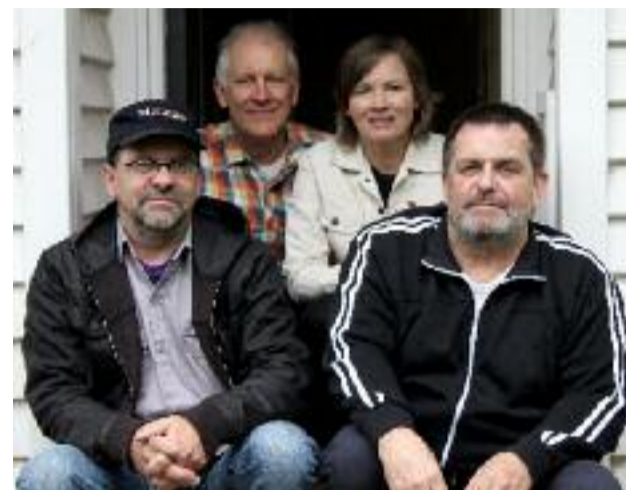
Bande de potes des antipodes

Rapidement, sur la foi de quelques EPs, le groupe se retrouve à tourner en Europe avec l'ex-Big Star Alex Chilton et reçoit l'onction du NME. De leur (tardif) premier album, Daddy's Highway (1987) - chef d'œuvre - au cinquième, Couchmaster (1995), tous