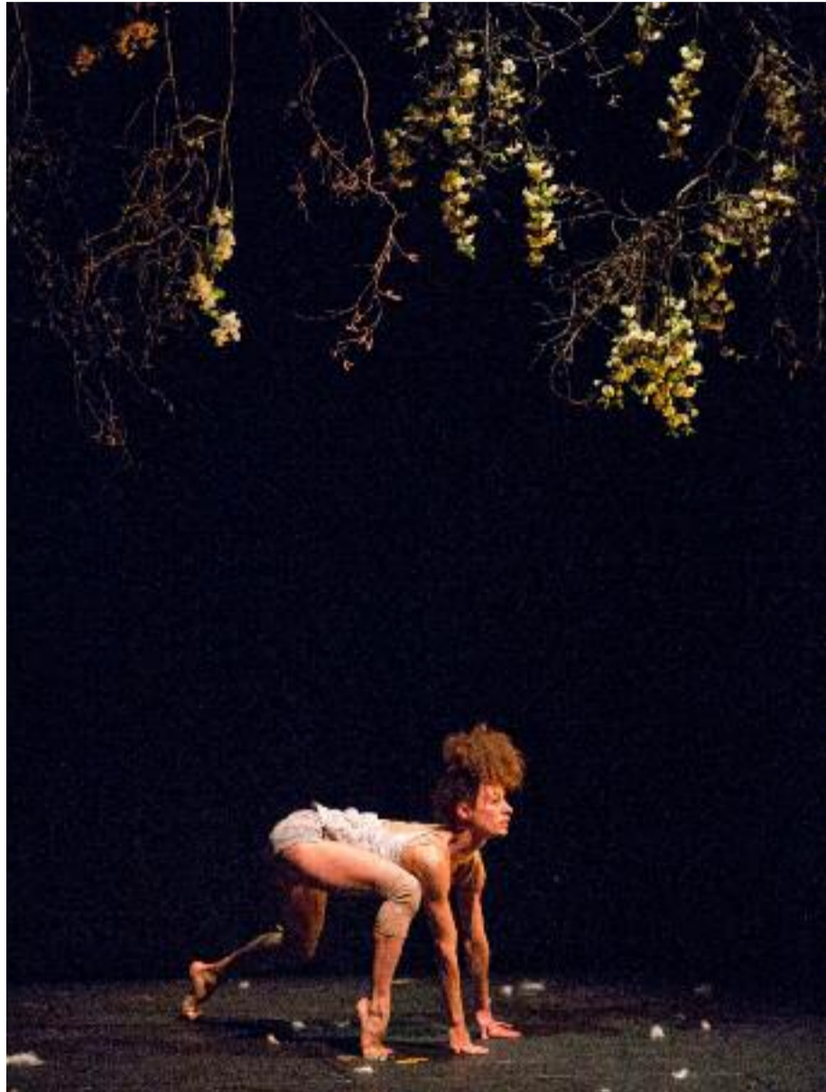
La Dernière saison du Cirque et Plume

Et c'est avec eux que les Nuits de Fourvière investissent pour la première fois le domaine de Lacroix-Laval en 2015, jusqu'à y créer un village qui, l'an dernier, a accueilli des formes simples mais dramaturgiquement très construites, comme le Petit Théâtre de Gestes ou les très théâtraux et dark Dromesko .