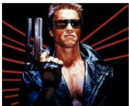
Un ami du Président

Comme à son habitude, le “perfectionneur” autant que perfectionniste James Cameron reprend pour les améliorer des concepts techniques ou narratifs préexistants... qu’il emprunte ici à deux de ses films précédents. Terminator (1984) pour la trame, bien nettoyée, poussée à un degré de subtilité supérieur ; et le