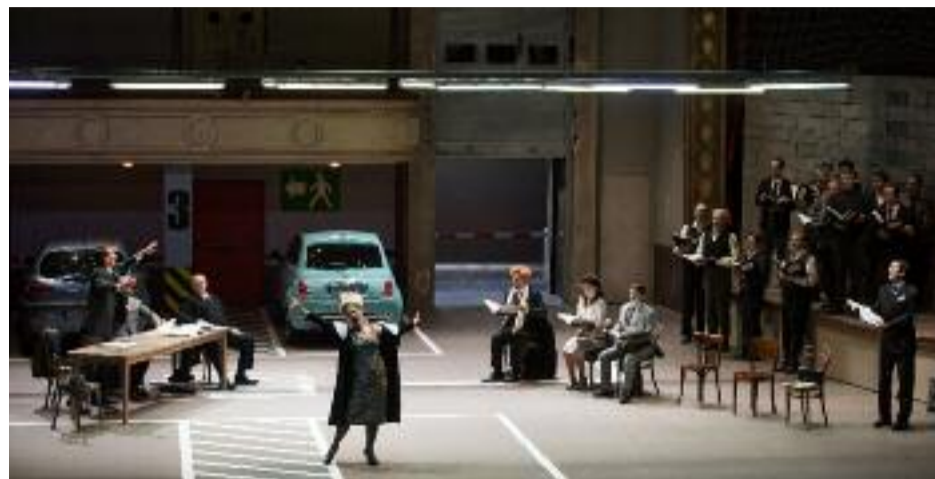
Ambiance garage à l'Opéra

Montrer sur scène les vicissitudes et les vices des divas de l'opéra. Voilà une mise en abyme ludique de Gaetano Donizetti qu'on dirait écrite pour Laurent Pelly. Le metteur en scène s'en empare avec son éternelle gourmandise. PAR NADJA POBEL