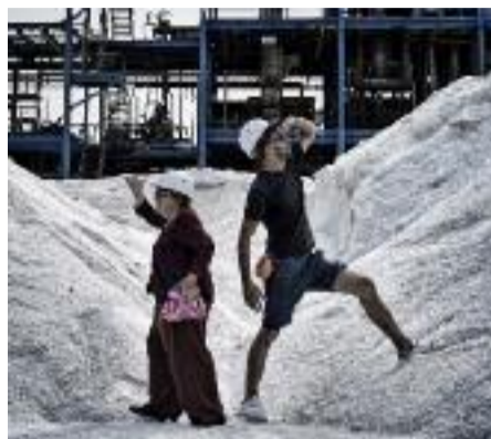
Un film sur le regard qui sent bon son strabisme

Bienveillante maïeuticienne, Varda obtient des fragments de vécu dont le récit surpasse par sa sincérité toute forme de construction plastique éphémère. Elle aussi se raconte, pudiquement, sans s'épargner cependant. D'ailleurs, lorsqu'elle accepte de se faire chamberer (photographier ou affectueusement moquer) par JR, c'est pour servir un sous-thème mélancolique : le chant du cygne de sa propre vision, grignotée par la maladie.