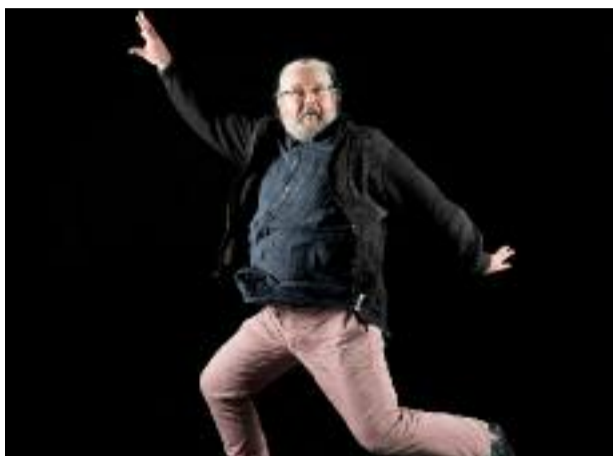
Michael Jordan a du souci à se faire