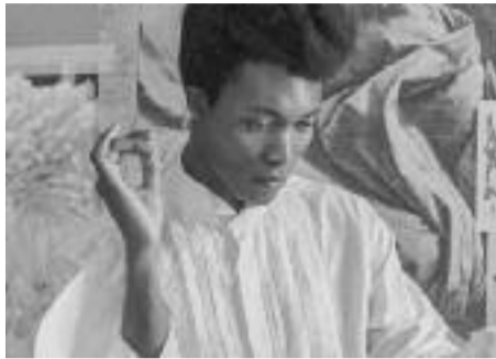
Oh my darling Clementine

Le titre figure sur le premier album de Clementine, At Least for now (2015), et depuis l'on n'avait guère revu sa longue silhouette couronnée d'une pompadour. Si ce n'est sur un titre et dans un clip éminemment politique de Gorillaz. Clementine y semble possédé, trem-