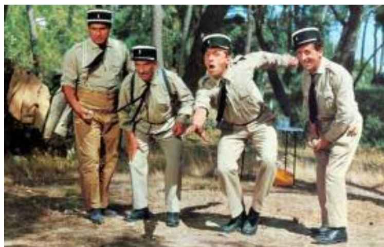
Pas trop les boules de bosser cet été ?

S i beaucoup d'établissements ferment ou ralentissent leur activité en été, cette période est pour d'autres secteurs au contraire la saison la plus productive. À commencer par l'agriculture. Période fertile par excellence, l'été est la haute saison pour qui travaille la terre. La plupart des fruits sont à cueillir ou récolter entre mai et septembre, et la région regorge de vergers : nous regroupons un cinquième des cultures fruitières de la France métropolitaine (selon l'INSEE). On peut aussi se targuer d'être la quatrième région viticole, grâce au Beaujolais, à la Vallée du Rhône et à la Savoie. Les vendanges, aux alentours du mois de septembre (les dates varient chaque année selon l'ensoleillement et les cultures), sont un bon plan pour les étudiants qui font leur rentrée en octobre. Il y a aussi la préparation aux vendanges, qui s'étend de mai à juillet. Pour trouver un employeur, rien de tel que le contact local et direct, comme les producteurs sur les marchés par exemple.