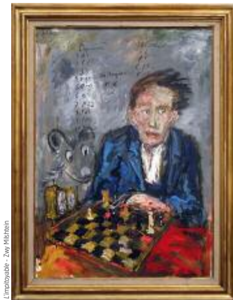
L'impitoyable - Zwy Milshtein

Jusqu'au 4 mars, du lun au ven de 10h à 18h30 et du sam au dim de 10h à 19h ; de 6,50€ à 9€