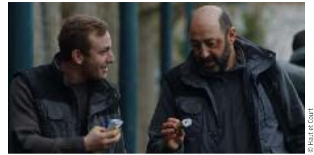
"-T'as vu ? Des sushis en francs !"

V olubile embobineur, Joseph a connu des jours meilleurs dans l'escroquerie. Pour se sortir de cette période un peu délicate, il pense pouvoir compter sur sa famille, en particulier sur Micka, son fils qu'il a patiemment formé. Mais ce dernier rêve d'exercer ses talents ailleurs : sur scène. Aspirer à être comme un roi, c'est un peu construire des châteaux en Espagne : viser un objectif prestigieux, tout en sachant inconsciemment en son for intérieur qu'il est d'une essence incertaine. On ne pourrait mieux résumer le personnage de Joseph, artisan-escroc à l'ancienne dont les talents de hâbleur ne lui permettent plus que de ramasser des miettes dans un monde contemporain le dépassant chaque jour davantage. Bateleur sans public, il demeure seigneur révérend d'une famille soudée dans le délit, mais assiste impuissant à la rébellion paradoxale de son fils dont il réprovoie les choix et déplore l'absence de conscience criminelle. Un fils qui, de surcroît, le surpasse dans sa branche.