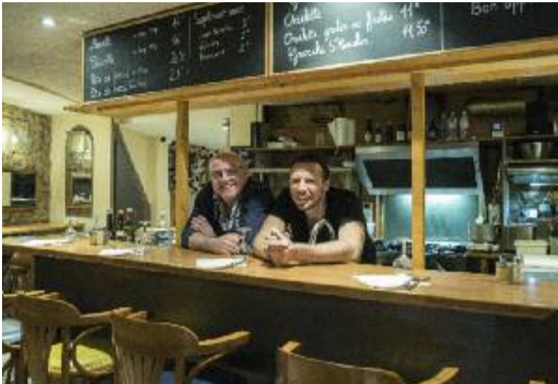
Ici, les gens sont souriants. Ça fait toujours plaisir...

Les Lyonnais l'affirment : la gratinée fut inventée entre Rhône et Saône. C'est une soupe d'oignons dorés, voire caramélisés, mouillés à l'eau ou au bouillon de bœuf, éventuellement au vin blanc, sur laquelle viennent se poser de grosses tranches de pain, parfois rassis, la soupière étant finalement saupoudrée de fromage râpé et passée au four. Peut-être est-elle effectivement lyonnaise, mais elle se rendit célèbre à Paris. Non pas dans les palaces, où on la sert parfois aujourd'hui agrémentée de truffe noire, mais aux abords des Halles - époque pavillons Baltard, le Ventre de Paris. Là-bas elle faisait le bonheur des manutentionnaires en marcel, les fameux "forts" qui la consommaient vers 5h du matin. Mais aussi des noctambules, qui appréciaient à l'aube ce plat revigorant. C'est donc certainement dès le XIX e siècle que la soupe à l'oignon (et croutons) est devenue le plat phare des nocteurs, consommé avant d'aller au lit pour "éviter la gueule de bois" ou pour recharger les batteries avant de partir en after, le plat ayant la réputation de remettre sur pied les plus épuisés - il est ainsi offert traditionnellement aux jeunes mariés, le lendemain de leur première nuit commune. La gratinée la plus célèbre de Lyon se mange dans le restaurant du même nom situé rue Terraille, à deux pas de la "rue de la soif". Quiconque a passé une partie de sa jeunesse ici retrouvera, dans un