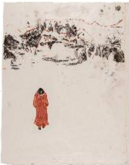
Une graine de la grenade (2018) © Arzu Başaran

L'artiste commence à se documenter, se procure des photos et son humanité parle et devient de plus en plus bavarde. « J'avais du mal à confronter mes amis arméniens, j'avais honte. » En 2008, elle peint une première toile sur le génocide et se rend sur le mémorial, très vite intervient la volonté de faire une exposition qui prendra place en 2017 dans une galerie d'Istanbul. Still there... (2017, Istanbul) fut très bien accueillie par « un public démocrate et ouvert sur le monde comme il y en a beaucoup en Turquie. »