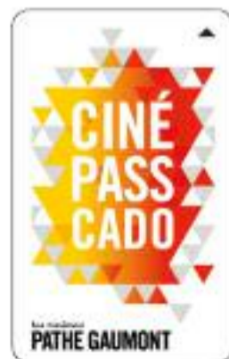
CINÉPASS CADEAU Cinéma à volonté (2)