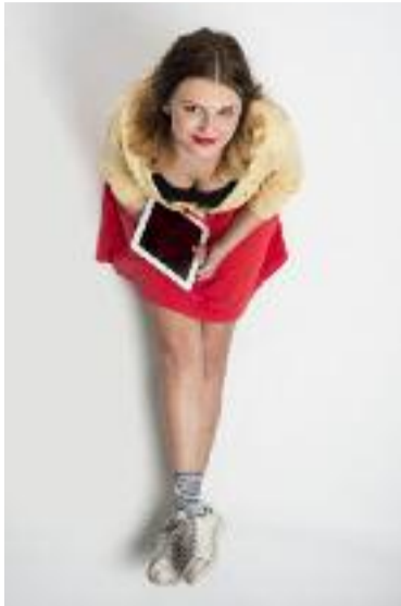
Tablette Jones ?