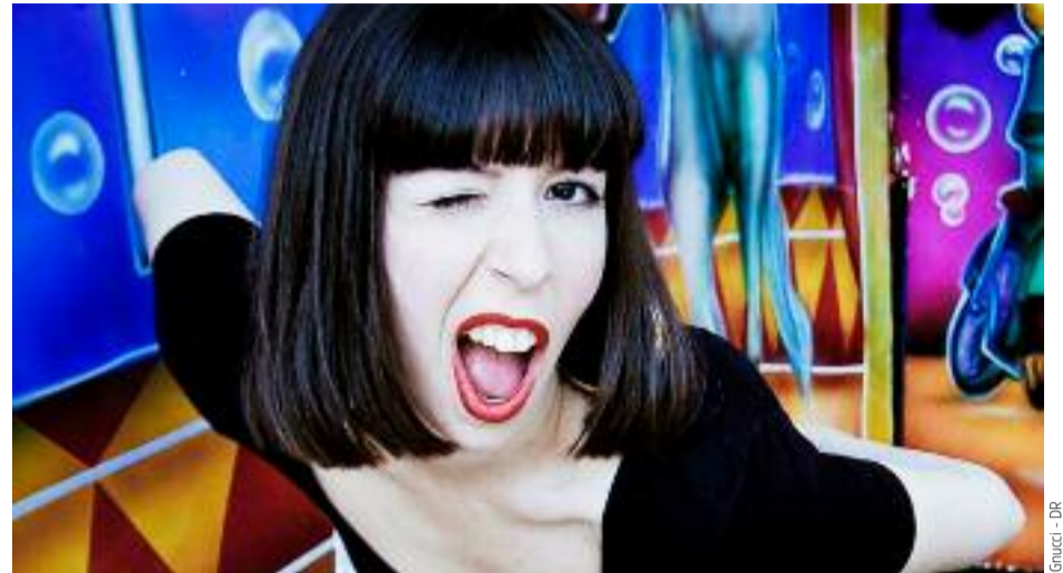
Alors, regard appuyé, que dit la Loi ?

C'est devenu un classique du passage vers une nouvelle année à Lyon : quitter le Sucre au petit matin, le maquillage un brin dégoulinant et checker l'after qui se profile, puisqu'il est hors de question de se coucher maintenant après une nuit de dérives hédonistes en compagnie de la bande la plus folle du clubbing d'ici, Plusbellelanuit. Cette Garçon Sauvage (déjà sold out, sorry) ne devrait pas déroger à la règle : L'Homme Seul est toujours là, résident fidèle, adepte du nu disco et de l'indie dance. Le fameux live de minuit est confié à Gnucci, rappeuse venue de Suède, qui dépossède le hip-hop de certains codes pour le plonger dans l'univers plus coloré de la tropical bass et de l'euro-