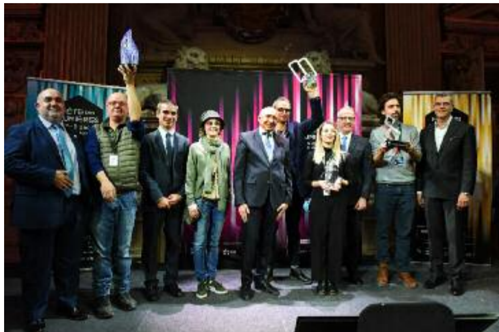
Les vainqueurs des différents trophées dimanche 9 décembre à l'Hôtel de Ville