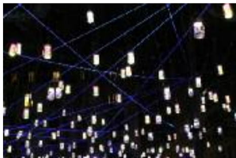
Lumière en Soï(e) Place Rambaud