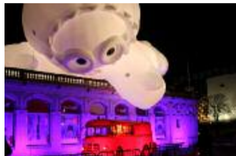
Un Anooki Place Bellecour