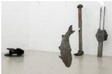
Poisson vole !