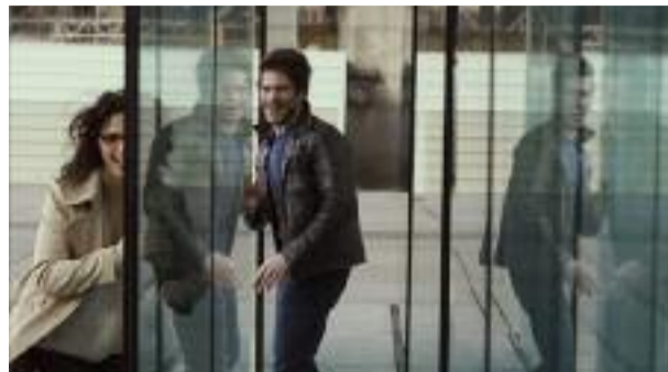
Et après, ils inventèrent les écrans portables...

Adapté d'un roman de Camille Laurens, Celle que vous croyez n'est justement pas ce que l'on pourrait croire – à savoir un thriller érotique, ni une fable sur la digitalisation des relations humaines. Portant sur la solitude et la peur de l'abandon, ce film se révèle également un exercice de style autour du récit, dans ses différents niveaux d'imbrication (avec peut-être un rebondissement final en trop) et l'incertitude de son authenticité : en effet, l'histoire est recomposée à partir du discours partiel de Claire à sa psy – aux omissions et travestissements de la vérité près – et se trouve amendée par un roman offrant une version alternative de la réalité. Tout est paroles, faux-semblants, mensonges et fantasmes dans ce qui résonne comme la version contemporaine d'un échange épistolaire libertin, d'une romance à la sensualité moins charnelle