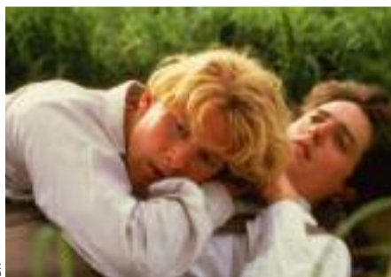
Some People call him Maurice

A l'aube de sa décennie, le festival du cinéma queer de Lyon monte en gamme en accueillant un vénérable pan de l'Histoire du 7 e art, James Ivory. Peintre assidu des mœurs britanniques et de l'époque edwardienne, adaptateur régulier de Forster ou d'Henry James, le cinéaste étasunien en a exploré les moindres recoins - flirtant parfois avec la redite, voire l'auto-caricature - dans une œuvre marquée par son goût pour les grandes passions entravées par le conformisme social, son idéalisation de l'Italie et de la jeunesse. De Maurice (photo) à Call me by your name (dont il a signé le scénario, et qui lui a valu un Oscar), en passant par Chambre avec vue , Ivory est devenu l'un des plus féconds créateurs d'icônes - pour ne pas dire de