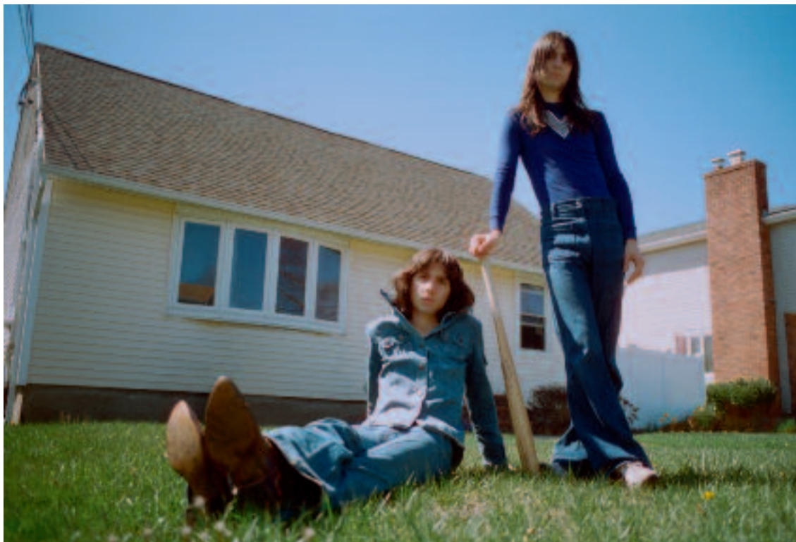
DR Ça va être batte !

Assumant leur jet-lag existentiel, c'est