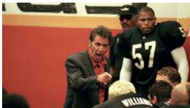
L'Enfer du Dimanche

coach de l'OL Bruno Genesio, Gérard Houllier et l'entraîneur du LOU Rugby Pierre Mignoni. De football, il sera encore question ensuite mais américain pour la diffusion de l'épique L'Enfer du Dimanche avec Al Pacino en entraîneur survolté.