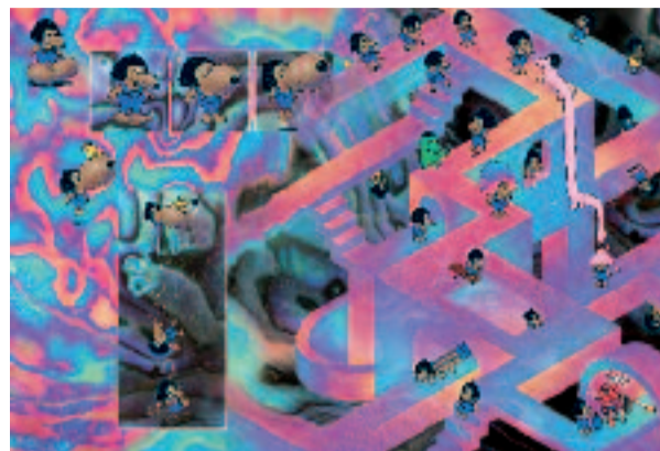
© Anouk Ricard & Étienne Chaize