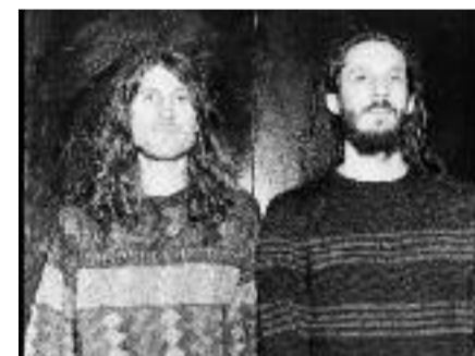
Le jeu des 7 différences

Invokant les démons (mais de la danse) comme nouvelle politesse du désespoir, Cyril Cyril "transe-forme" ainsi ce qui pourrait être