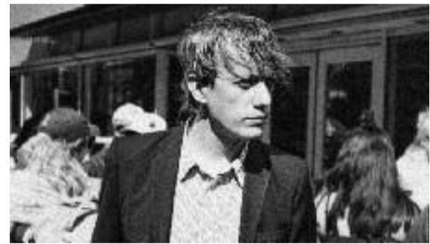
On avait dit pas les cheveux

Il aura fallu pour cela que le guitariste perde son père et se plonge, comme poussé par ce cruel déclic, dans une écriture de l'intime qui semble comme