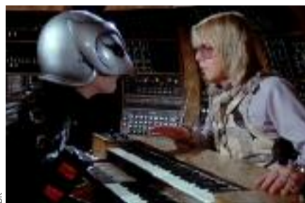
Cascadeur et Casque d'Or

[Moment vieux con] Aux jeunes publics qui pensent que Freddie Mercury et Queen ont tout inventé avec Bohemian Rhapsody , on recommande chaudement d'aller faire un tour à l'Institut Lumière pour découvrir en grand Phantom of the Paradise (1974) pour tant de raisons que cette page n'y suffirait pas. Essayons tout de même. Il s'agit d'abord d'une relecture-réactualisation du classique Fantôme de l'Opéra de Gaston Leroux - déjà porté à l'écran avec Lon Chaney -, matinée de références au Faust de Goethe comme à l'indispensable figure matricielle du cinéma de Brian De Palma, Alfred Hitchcock. S'il reçoit un très mérité Grand Prix au festival d'Avoriaz en 1975, c'est en tant que comédie musicale rock innovante qu'il marque