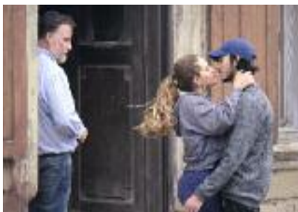
C'est ça l'amour, vieux

S a femme l'ayant quittée, Mario est tout tourneboulé. S'accrochant à l'espoir de la voir revenir, il tente avec sa maladroite bienveillante de préserver ses filles du cataclysme qui les ronge tous. Mais rien n'est facile dans cette famille de guingois : même l'amour en a pris un coup.