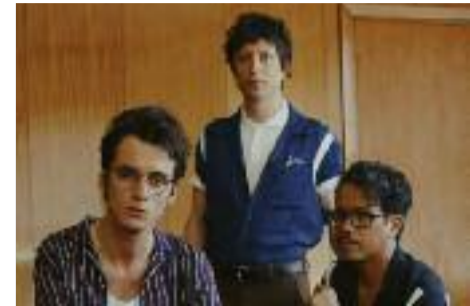
Blue suede jacket

Ce serait donc Ces garçons-là , Radio Elvis. Ceux qu'on trouve sur cet album moins frontal mais plus direct, cherchant une profondeur plus personnelle. Une réalité à saisir au fil de la plume de Pierre Guénard moins abstraite, moins onirique, plus encline à ramasser la réalité et à la