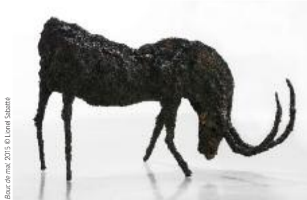
Bouc de mai, 2015 © Lionel Sabatté

Dans la cour du Musée Gadagne, fondu ou presque dans ce hâvre du 16 e siècle, Lionel Sabatté présente un mûrier en fleurs, dont