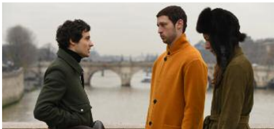
Orange is the new beûârk

E x soldat israélien en violent désaccord politique et humain avec son pays, Yoav débarque sac au dos à Paris. Détroussé et entièrement nu à la suite d'un rocambolesque coup du sort, il rencontre Émile et Caroline, un couple aisé de son âge qui va l'aider à rebondir et à se reconstruire... Nadav Lapid ne fait pas mystère de la large inspiration autobiographique de ce film, narrant autant sa rupture d'avec sa patrie de naissance que son désir quasi-amoureux de s'enraciner en France. Un nouveau pays dont le personnage de Yoav aime le "concept" avant même de l'avoir pratiqué et dont il englutit avec voracité le lexique, les fondements républicains afin d'en assimiler l'essence. Mais un lien fabriqué présente toujours le risque d'être artificiel. Car même si Yoav repart de zéro à Paris nu comme l'enfant qui vient de naître, s'il ap-