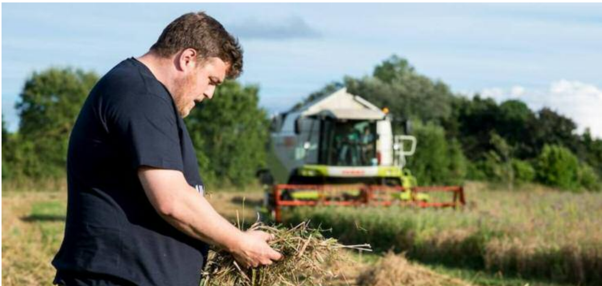
Il était un foïn...

Il existe 1550 brasseries en activité aujourd'hui en France. Le pays en comptait 3360 en 1903. Près de 2000 disparurent après la Première guerre mondiale, et entre 850 et 900 après la Seconde guerre mondiale. « À l'issue de ces deux conflits, les entreprises n'avaient plus assez de ressources pour passer le cap de la reconstruction et de la relance commerciale. Dans les années 50, des moyens de transport autorisent une plus grande concurrence entre les régions de France. Mais le principal impact viendra de l'étranger, avec l'avènement des bières de fermentation basse, du type Pils, dont le berceau se situe à Plzeň, en République tchèque. Pour produire en fermentation basse, les investissements à consentir sont énormes : nouveaux équipements, nécessité de maîtrise du froid industriel... » analyse Emmanuel Gillard, biérologue et auteur du site Projet Amertume, dans son livre La bière en France. C'est en 1985 qu'on assistera à la renaissance d'une première microbrasserie en France, dans le Finistère. Le mouvement est lancé. Aujourd'hui, une brasserie ouvre environ tous les deux jours en France.