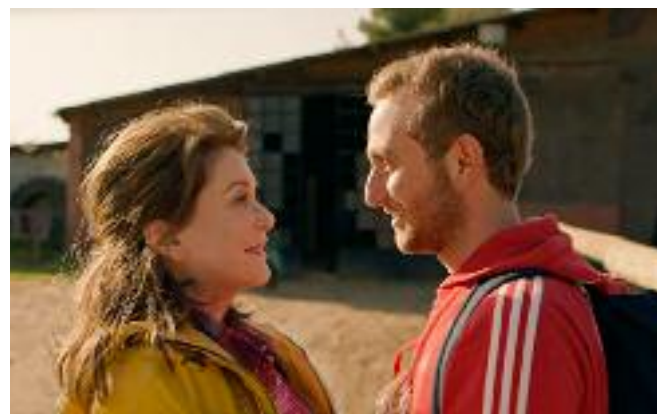
Catherine Deneuve (en brune, à gauche)

Sans que jamais la ligne dramatique ne soit perturbée par le poids de la matière documentaire dont il s'inspire, L'Adieu à la nuit révèle l'effrayante virtualité dans laquelle évoluent les jeunes candidats au sacrifice : ils ne fréquentent pas les lieux de culte, se marient en ligne... Tout est fait pour les maintenir dans