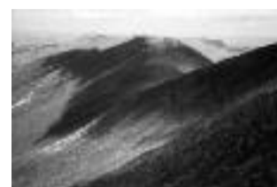
Que la montagne est belle-eh