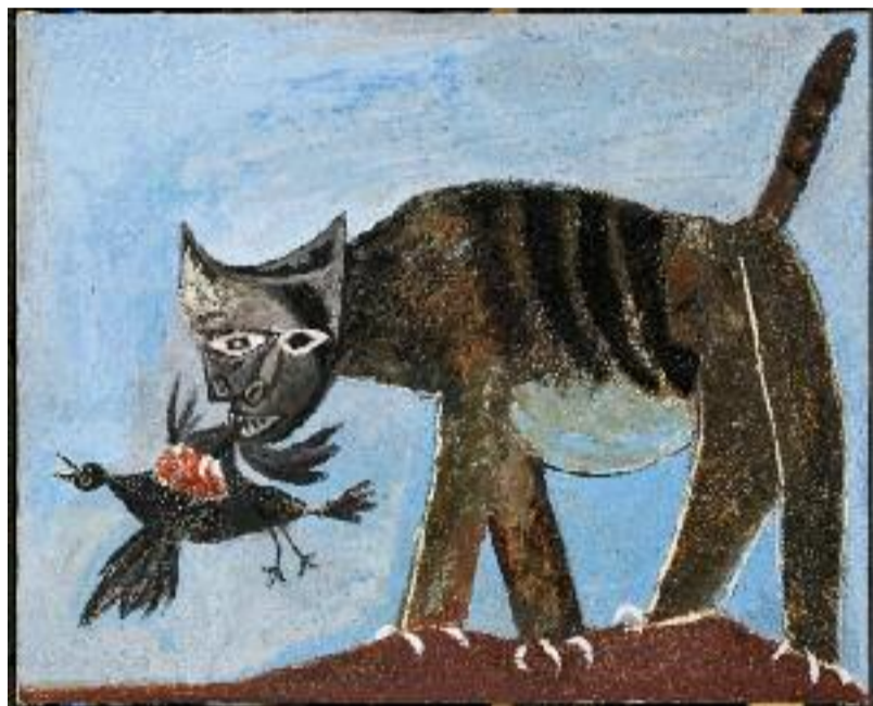
Picasso, « Chat saisissant un oiseau » © RMN-Grand Palais - Mathieu Rabreau

Encore un qui n'avait pas de croquettes à midi