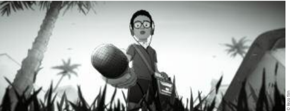
Le monde du cinéma lyonnais se donne la parole. Pourvu qu'il s'écoute !

S i aucun spectateur lyonnais n'ignore plus que sa ville fut le berceau du Cinématographe Lumière, mesure-t-il seulement ce que représente aujourd'hui pour la métropole le 7 e art – par ailleurs une industrie (et d'autre part un langage) ? Non seulement l'agglomération lyonnaise présente un taux d'équipement cinématographique et une fréquentation supérieurs aux autres grandes aires urbaines de province, mais elle abrite de nombreuses filières de formation comme de production actives et réputées. Une galaxie de talents qui, souvent, éprouvent paradoxalement un sentiment d'isolement malgré de nombreuses tentatives pour faire émerger des synergies entre structures établies, collectifs d'artistes, associations, professionnels de l'audiovisuel aguerris ou débutants, qu'il s'agisse d'amateurs de formes alternatives, traditionnelles ou innovantes. Afin de fédérer un peu mieux un écosystème riche de potentialité (et le faire marcher en