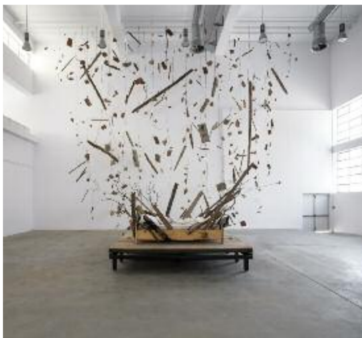
Une œuvre explosée

Le parcours du visiteur, au travers des œuvres de 56 artistes (une sélection paradoxalement plus restreinte qu'à l'accoutumée lors d'une biennale), totalisera 1,4 kilomètres de marche. Et la découverte sera totale, car la quasi intégralité des œuvres exposées seront des créations, réalisées en tenant compte de l'histoire du