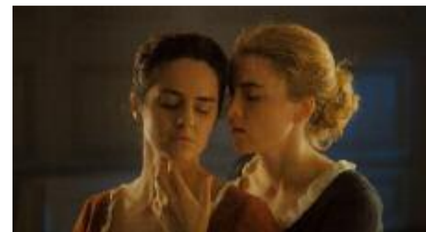
Les feux de l'amour, version XVIII e

Il est courant de dire des romanciers qu'ils n'écrivent jamais qu'un seul livre, ou des cinéastes qu'ils ne tournent qu'un film. Non que leur inspiration soit irrémédiablement tarie au bout d'un opus, mais l'inconscient de leur créativité fait ressurgir à leur corps défendant des figures communes ; des obsessions ou manies constitutives d'un style, formant in fine les caractéristiques d'une œuvre. Et de leur singularité d'artiste. Ainsi ce duo Héloïse-Marianne, autour duquel gravite une troisième partenaire (la soubrette), rappelle-t-il le noyau matriciel de Naissance des pieuvres (2007) premier long-métrage de Céline Sciamma : même contemplation fascinée pour une jeune femme à l'aura envoûtante, déjà incarnée par Adèle