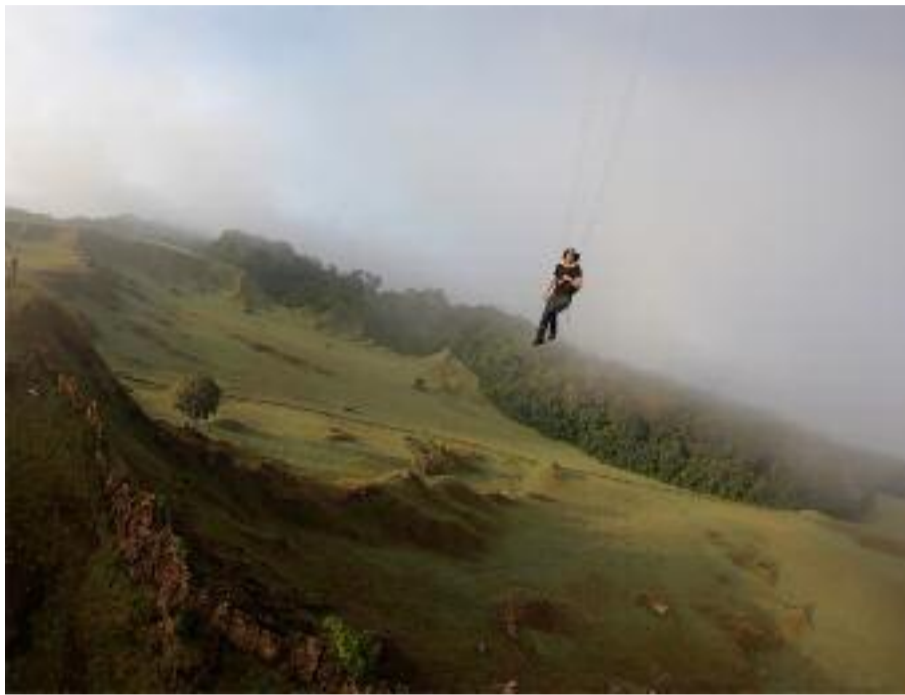
Un artiste perché

Abraham Poincheval, « Marche sur les nuages », © Adapp / Christophe Fiorietta