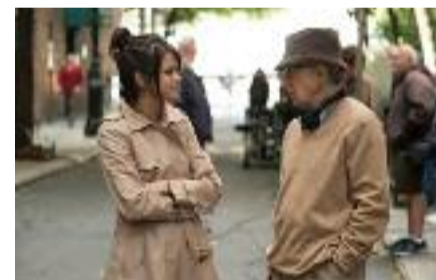
« - Tu sais, tu pourrais être ma petite-fille... - Et ta femme ? »

Et si l'on doit admettre de ne frayer ici – une fois encore – qu'avec des démocrates érudits ayant des névroses de couple et résidant autour d'un Central Park réchauffé par les couleurs de l'automne, faut-il en plus supporter des dialogues d'une prévisibilité caricaturale et inégalement pétillants ? Une photographie médiocre, artificielle, parfois franchement terne, prouvant que le numérique ne réussit pas à Vittorio Storaro ? Le jeu tout en mimiques meg-ryannesques de Elle Fanning et la composition mimétique de Timothée Chalamet, clonant la silhouette du metteur en scène (tenue marron-kaki-beige, mains dans les poches, tête dans les épaules...) ?