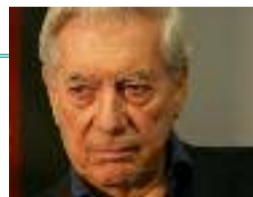
Mario Vargas Llosa