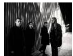
The Psychotic Monks

À une Messe de Minuit, c'est bien connu, il vaut mieux arriver à l'heure, d'autant plus quand celle-ci commence en début de soirée. Ce sera aussi le cas pour le nouveau festival concocté par Cold Fame où rien n'est à jeter et tout à voir. À commencer, en ouverture le jeudi 19 à l'Épicerie Moderne, par les hôtes de l'événement Last Train dont le dernier album The Big Picture a des allures d'incendie général. Le lendemain, le Périscope accueille le rock pressé et racé des Londoniens de Bad Nerves et le post-punk de Structures. Et pour finir, le samedi 21 au Transbordeur, Fat White Family entrainera dans son sillage une montagne de décibels avec justement les filles de Decibelles, les brumeux Psychotic Monks, les teigneux Lysistrata, Bandit Bandit et les classieux Yak.