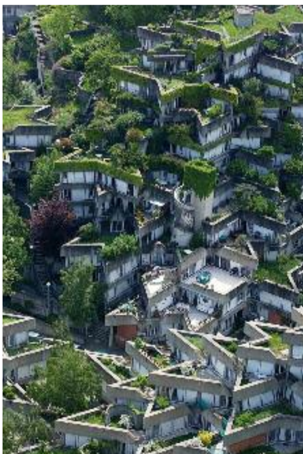
Où est Charlie, édition Givors-ville