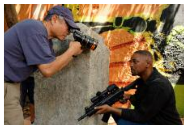
« Whaat do you want ? (...) This not a method ! »

Dans les deux cas, je cherche à conserver la même intimité dans l'approche de l'humain et du récit. C'est essentiel, sur-