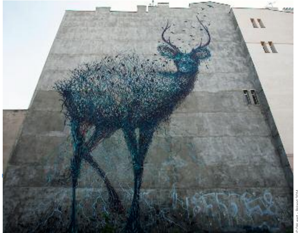
Il y a une fracture murale

At moins quatre immenses fresques viendront embellir la ville à l'occasion de la conférence de reconstitution des ressources du Fonds mondial qui se tiendra à Lyon, le 10 octobre prochain. En amont de cette conférence, les figures du street art que sont la Sud-Africaine Faith 47, le Chinois DALeast, le Portugais Add Fuel et le duo new-yorkais FAILE composeront ces fresques dans divers lieux de la ville, invités par (RED).