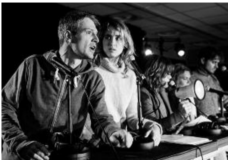
Dans la BD, il y a des bulles. Comme dans la bière

claire et confie une carte blanche au festival du 18 au 29 décembre prochain avec le spectacle Zai Zai Zai Zai adapté de Fabcaro et mis en scène par Paul Moulin pour huit comédiens et comédiennes (également au Théâtre de Vénissieux le mardi 15 octobre), l'exposition Badass - Les Nouvelles Héroïnes avec en point d'orgue une jour-