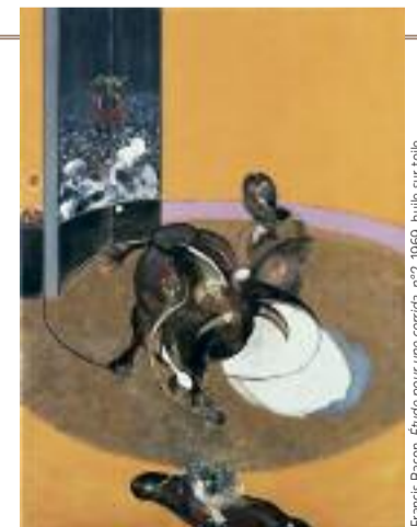
Francis Bacon, Étude pour une corrida, n°2, 1966, huile sur toile