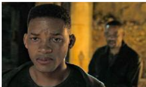
Nous sommes deux candidats, à égalité