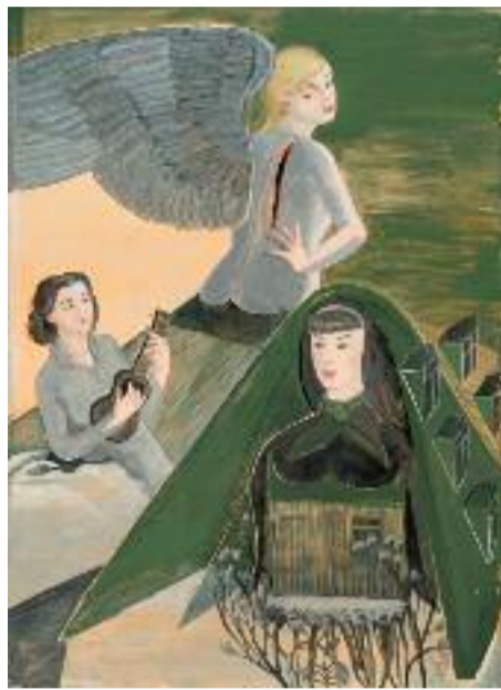
C'est beau mais c'est loin

Rosa Loy semble elle aussi être revenue à l'essentiel : à la terre, à la nature, aux plantes et aux corps féminins, habillés ou nus. Ses toiles sont exclusivement composées de personnages féminins à la mine adoucie, complice et bienveil-