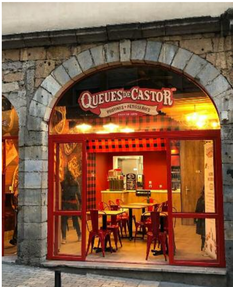
« Ma cabane au Canada / Est blottie au fond des bois » (Line Renaud)

La pâte faite de blé entier est étirée à la main (pour ressembler à une queue de castor), frite dans de l'huile de canola (Colza), recouverte de garnitures sucrées au choix (cannelle, vanille, érable, caramel, sucre, citron, chocolat, beurre d'arachide, banane, chantilly...) et servie chaude (certaines peuvent être réalisées en version vegan). C'est bon, c'est fat, c'est addictif (le fait que la pâte soit moelleuse à l'intérieur et croustillante à l'extérieur n'y est certainement pas pour rien). Le casse-dalle idéal pour tenir tête à l'hiver qui arrive.