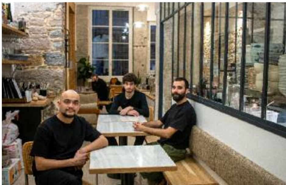
Leur tête quand on leur a demandé un Venti Frappuccino !