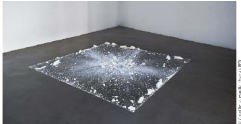
© Vincent Gernot - exposition «Seuil» à la BF15