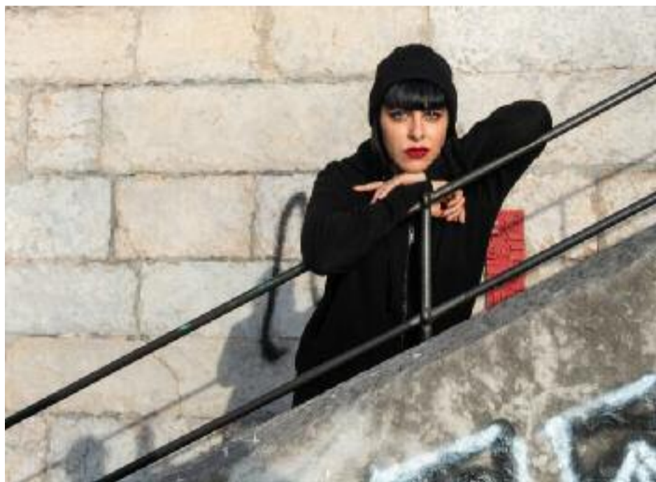
En rouge et noir, une histoire d'exil et de peur...

Dès la sortie de l'aéroport, Carmen confie avoir, pour la première fois de sa vie, ressenti jusqu'au fond de ses tripes « la mort qui est partout, cette possibilité qu'un type peut débouler de nulle part et te coller une balle. » Probabilité qui au Guatemala a souvent tendance à se changer un peu vite en certitude. Mais, le pays n'étant pas à une contradiction près, une poignée d'au-