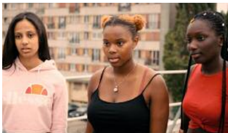
les Misérables

Enfin, on ne saurait trop recommander à tout spectateur curieux des arcanes de l'exploitation cinématographique d'assister vendredi 31 janvier entre 14 et 17h à la table ronde organisée avec le GRAC, "Quand un film sort au cinéma !", histoire de comprendre la mécanique d'horlogerie présidant à la