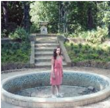
© Sophie Knittel, « La Chute d'Attica »

Commissaire d'exposition et photographe documentariste, Sophie Knittel signe-là (après d'autres projets remarquables comme L'heure du loup réalisé en forêt, ou les gestes quotidiens de couples d'amoureux) une série à la frontière