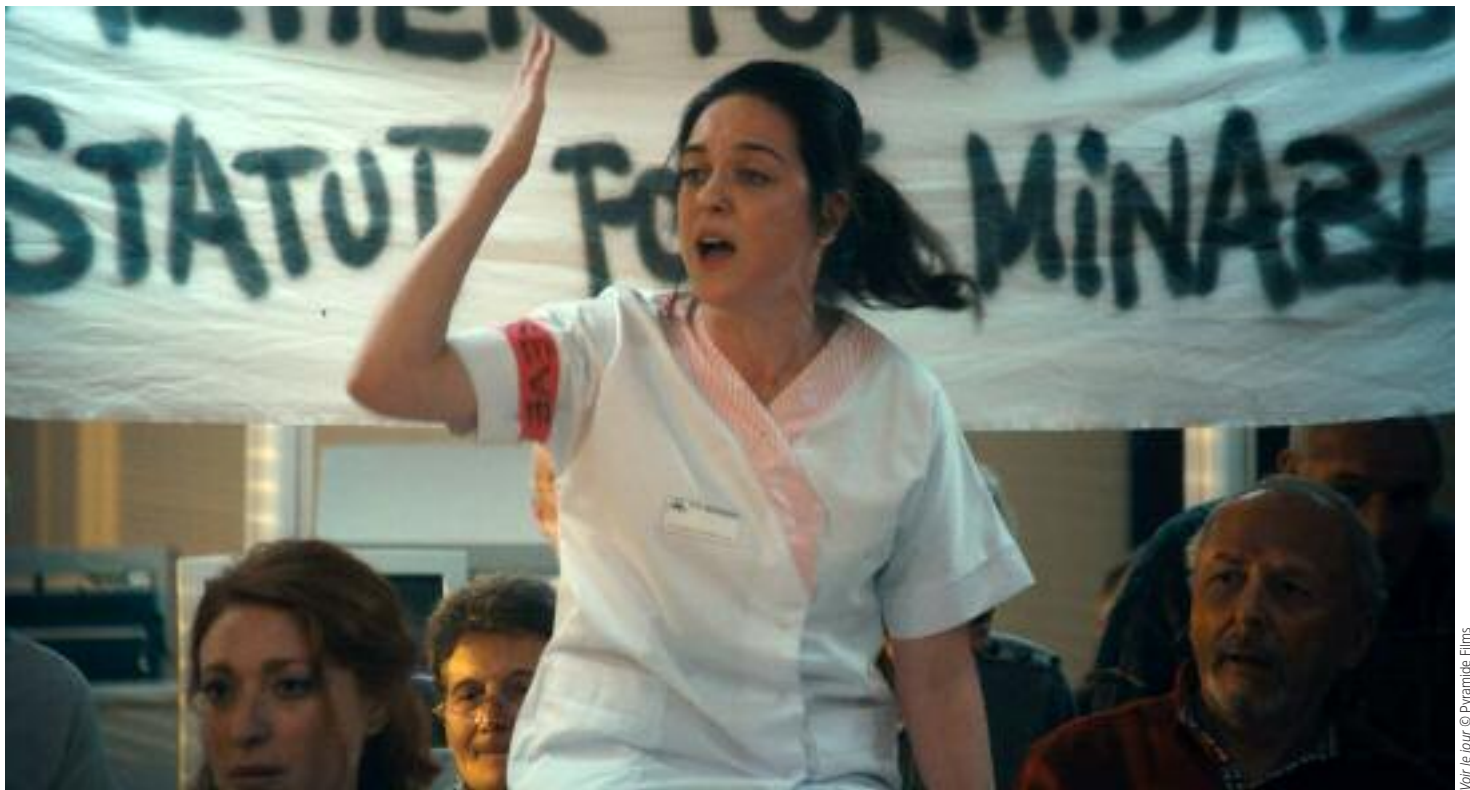
Voir le jour

Si après octobre 2017 et le scandale Weinstein, l'ensemble de l'industrie et les tutelles ont multiplié les déclarations d'intentions (comme l'annonce d'un bonus de 15% dans les subventions pour les films dont les équipes sont exemplaires en matière de parité) ou les résolutions (la création du collectif 5050 en 2020), le secteur part de loin. Dans son étude de mars 2019 portant sur La Place des femmes dans l'industrie cinématographique et audiovisuelle, le CNC relevait notamment que 23,3% des longs-métrages réalisés en 2017 l'avaient été par des femmes – chiffre dérisoire, et pourtant en hausse de... 62,8% par rapport à 2008 ! Ledit rapport ne s'intéresse pas (et c'est bien dommage) à la proportion de directrices dans les festivals, ni à la part des femmes dans les comités de sélection/programmation ; sûr que les pourcentages n'atteignent pas la barre des 50%. « J'aimerais bien savoir un jour combien nous sommes, s'agace Nadia Azouzi, directrice du cinéma Les Alizés et des Rencontres, car cela reste un métier d'hommes. »